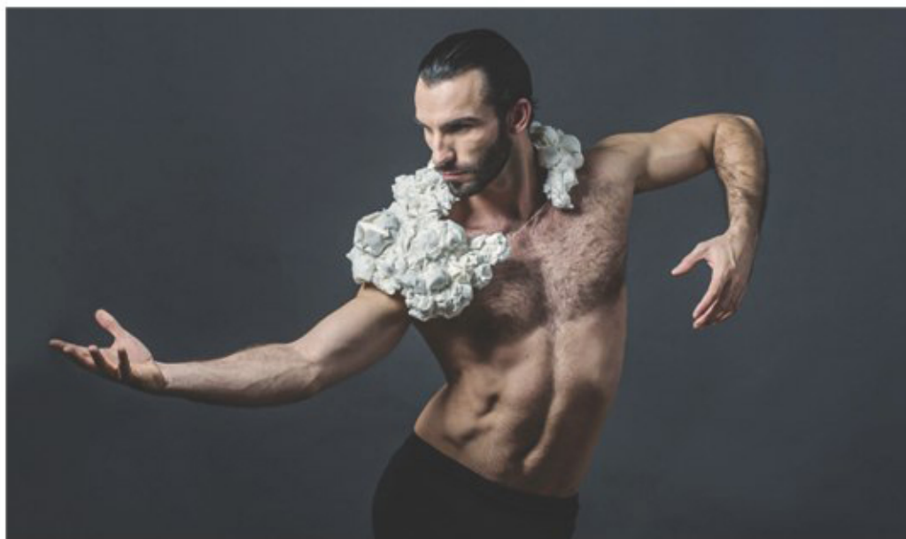
Ci-dessus : Marie Grimaud, collection Nébuleuses , 2014, papier japonais, or et diamants, H. 30 cm.

Entre joaillerie traditionnelle et parure artistique, Marie Grimaud mêle les matières et les savoir-faire dans des créations hybrides et poétiques.